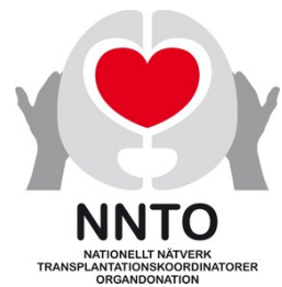
Figur 4 logga NNTO

* NNTO - Nationellt Nätverk Transplantationskoordinatorer Organdonation, är ett nätverk inom Svensk Sjuksköterskeförening, SSF. I nätverket samlas alla Sveriges transplantationskoordinatorer som arbetar med organdonation från avlidna givare.